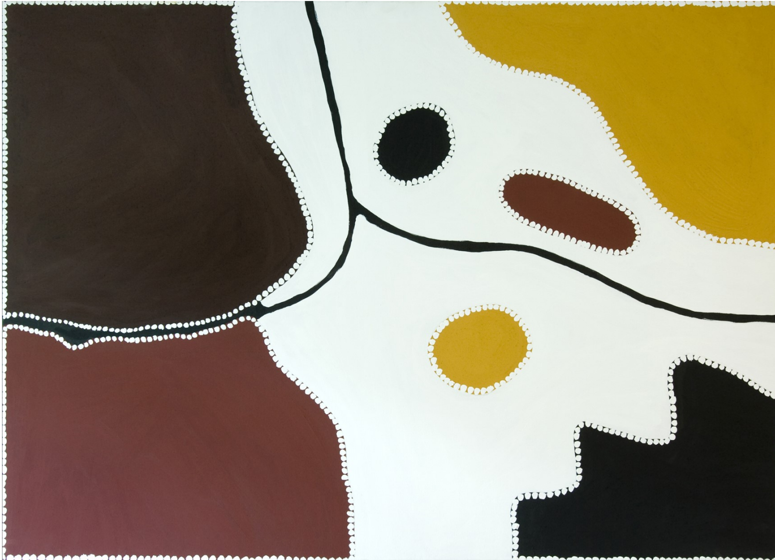
4 DREAMINGS MALEREI DER AUSTRALISCHEN ABORIGINES