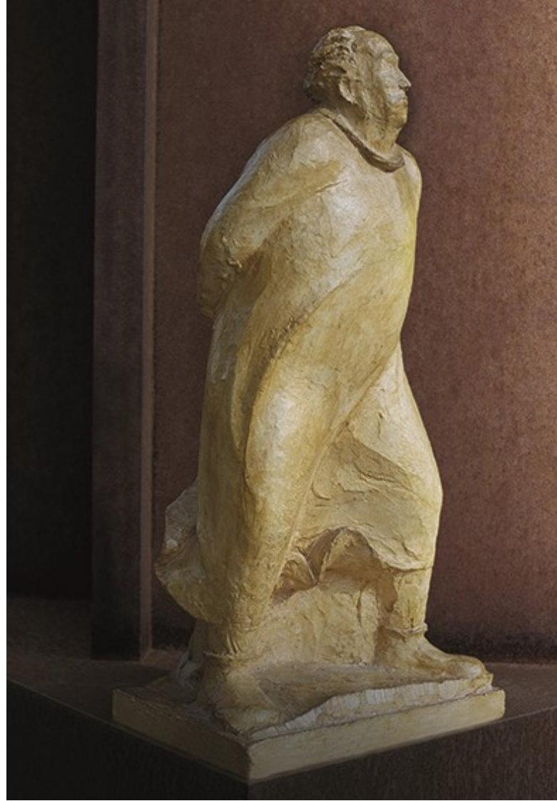
3 ERNST BARLACH